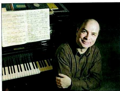
Philippe Cassard.

Richard Strauss sont passées à la postérité. En 2012, la soprano se renouvelle en enregistrant son premier récital de mélodies dans le « Clair de Lune » de Debussy avec le pianiste Philippe Cassard.