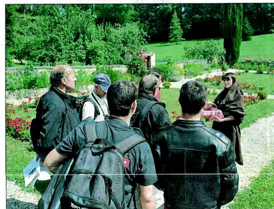
Fontdouce, un lieu de détente et de plaisir où se mêlent expositions et visites.

Et c'est ainsi que l'abbaye nous a dévoilé ses rondeurs dans une ambiance chaleureuse. Un week-end qui s'est positionné sur le thème de la surprise et de la gourmandise.