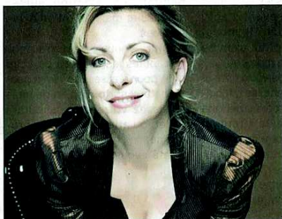
Natalie Dessay.

Cantatrice à la personnalité mutine et affirmée, Natalie Dessay est devenue, au cours des années, une artiste de tout premier plan sur la scène musicale classique française. Natalie (sans "h", hommage discret à Natalie Wood) grandit à Bordeaux. Après s'être réveillée danseuse étoile, elle entame des études de chant, catégorie soprano léger. Elle progresse à pas de géant et quitte le conservatoire avec un premier prix. Passant avec aisance de rôles légers à un registre tragique, la belle Bordelaise nous prouve que rien n'empêche les divas d'opéra d'être des stars au sens le plus moderne du terme. Ses prestations