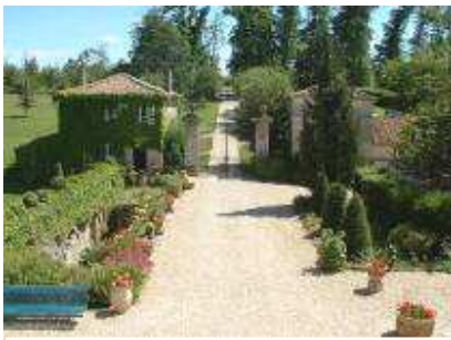
Salle des moines avant les fouilles