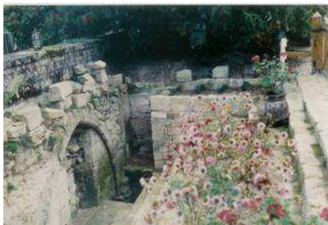
Arcades est de la salle des moines, 1975

Dès l'été 1970, un an après les partages, guidés par leur curiosité, les deux frères se munissent de pelles et de pioches, pour creuser juste devant leur maison familiale. A leur plus grande surprise, ils mettent à jour les arcades d'une salle qu'ils croient être le « scriptorium » (salle dédiée, à l'époque des moines à la lecture et à la copie de manuscrits) et que les archéologues rebaptiseront en 2006, « salle des moines ».