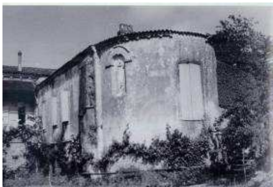
Chapelles superposées, années 1950

Au cours de la décennie 80, un travail minutieux de taille de pierre et de restauration est effectué, fenêtre après fenêtre, porte après porte , pour redonner la configuration d'origine aux salles médiévales transformées en caves au fil du temps.