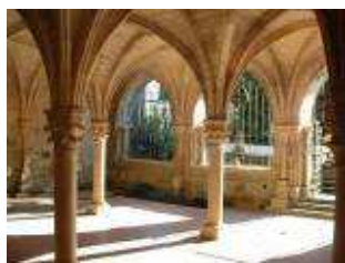
L'abbaye de Fontdouce est située entre Saintes et Cognac.

Le site, devenu une simple ferme, est ensuite transmis de génération en génération sans jamais quitter la famille Boutinet.