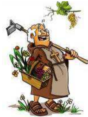
Moine Rémi, figurine créée pour les enfants