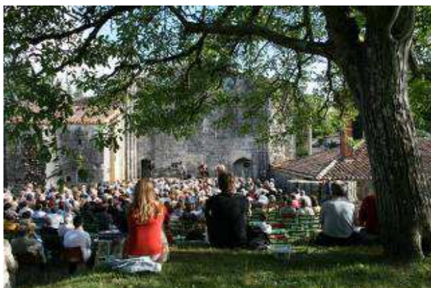
Concert de jazz dans l'enclos abbatial