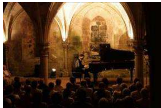
Récital de piano dans la salle capitulaire