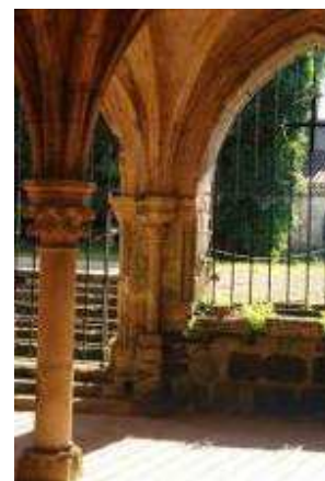
La salle capitulaire, avant, pendant et après les fouilles.

En 1976, avant de poursuivre le déblaiement de la salle capitulaire, ils s'attèlent au dégagement de la chapelle basse, qui s'achèvera en l'espace d'un an.