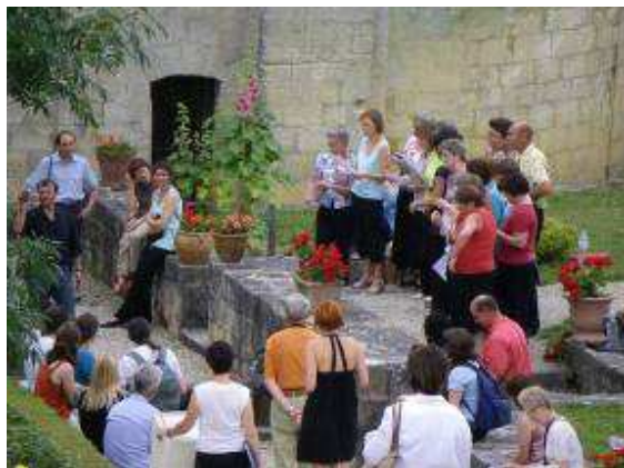
Chorale dans les jardins