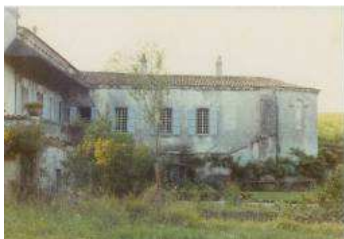
Jardins, années 1970

Puis, les années 90 sont consacrées à l'aménagement extérieur de l'abbaye avec les différents bassins qui contribuent au charme du lieu et la constitution d'un jardin à la française.