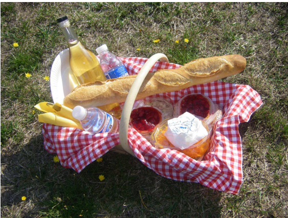
Panier charentais, une formule champêtre