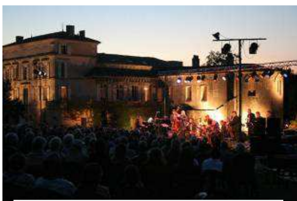
Concert de jazz sur le pré