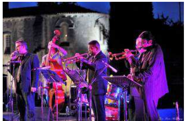
Festival de l'Abbaye de Fontdouce, 2009

Au cours des années 1990, la famille organise ses premiers concerts dans une grande intimité (moins de 30 personnes sont présentes lors des premières animations) qui serviront de « rampe de lancement » à un festival devenu aujourd'hui un rendez-vous d'envergure régionale.