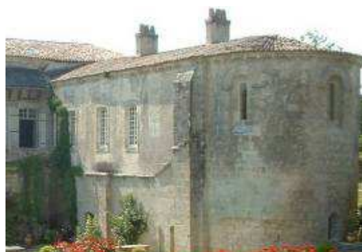
Chapelles superposées, 2009

En 1986, la totalité du site de l'Abbaye de Fontdouce est classée Monument Historique.