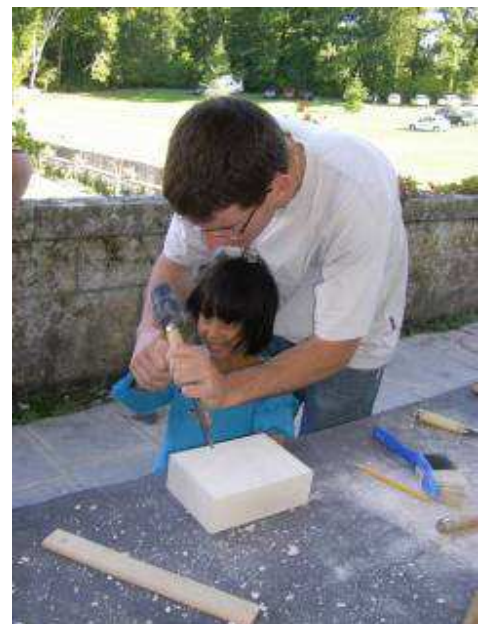
Atelier taille de pierre pour les enfants