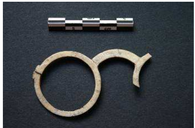
Monture en os, datant du XVI e siècle, retrouvée dans les fouilles

Il reste à reconstituer cette salle : les travaux, qui ont débuté en novembre 2008 ont permis de couvrir l'espace mis à jour. Dans un second temps, l'aménagement intérieur a été initié de façon à redonner vie à cette salle restée sous 4m de remblais pendant des siècles.