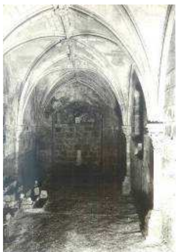
Auditorium, quelques mois après le déblaiement du remblai en 1975

Chaque été, durant les congés, les travaux s'enchaînent alors avec les voisins, les amis, la famille pour dégager le remblai accumulé par les moines eux-mêmes durant les XVIIe et XVIIIe siècles, dans les salles situées sous la maison familiale. Les dessous de la maison délivrent ainsi progressivement tous leurs secrets !