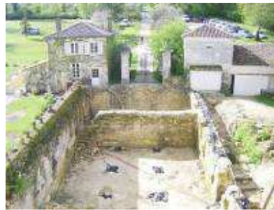
Fouilles en 2006