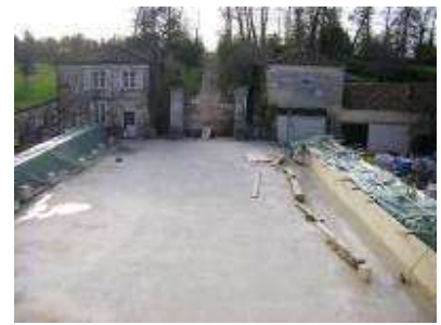
Travaux en 2009

Il s'agit de plus d'une véritable réserve archéologique dans laquelle ont pu être découverts un rare exemplaire d'une monture de lunettes datant du XVI e siècle et élaborée à partir d'un os, les restes d'une bulle papale et divers objets de cultes ou artisanaux qui permettent de dater les différentes couches de remblai.